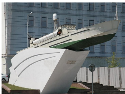
Памятник героическим морякам-черноморцам

Особо отличились в борьбе за Новороссийск корабли Черноморского флота. Так, в начале сентября 1942 г, эскадронный миноносец «Сообразительный» и лидер «Харьков» нанесли мощные артиллерийские удары по скоплениям немецких войск на подступах к городу. Несмотря на героические усилия защитников Новороссийска, силы были неравными, и 7 сентября 1942 г. врагу удалось войти в город и захватить в нем несколько административных объектов. Но уже через четыре дня гитлеровцы были остановлены в юго-восточной части города и перешли к оборонительной позиции.