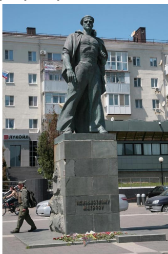
Памятник неизвестному матросу

Начиная с 19 августа 1942 года части Северокавказского фронта совместно с силами Черноморского флота и Азовской военной флотилии проводили Новороссийскую оборонительную операцию. Им противостояла ударная группировка врага 17-й группы армий «А» в составе 5-го немецкого армейского и 7-го румынского кавалерийского корпусов. Пользуясь численным преимуществом, 28 августа противник начал наступление на Новороссийск и 7 сентября захватил большую часть города. Несмотря на упорные атаки, 11 сентября враг был остановлен в юго-восточной части Новороссийска, а к 26 сентября он сам был вынужден перейти к обороне. План немецкого командования по прорыву к Туапсе и в Закавказье был сорван.