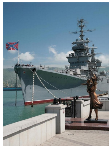
Крейсер "Михаил Кутузов"

Город герой Новороссийск. Мемориал "Малая земля".